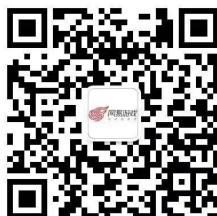
“网易游戏互娱校园招聘”微信公众号

手机端网申入口：扫描二维码关注“网易游戏互娱校园招聘”微信公众号，点击“投递简历”-“2021校园招聘”